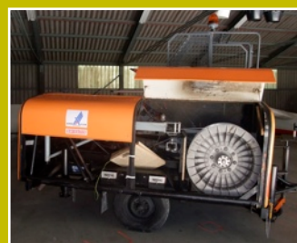
Unsere neue Winde hat sich bewährt...