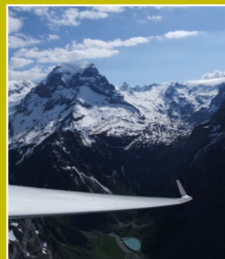
Wir freuen uns auf die Saison 2011....