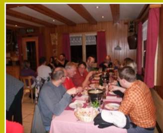
... Ein gemütliches Fondue nach rasanter Schlittelfahrt.