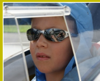
....und auch den kleinsten Nachwuchs in die Luft gebracht...