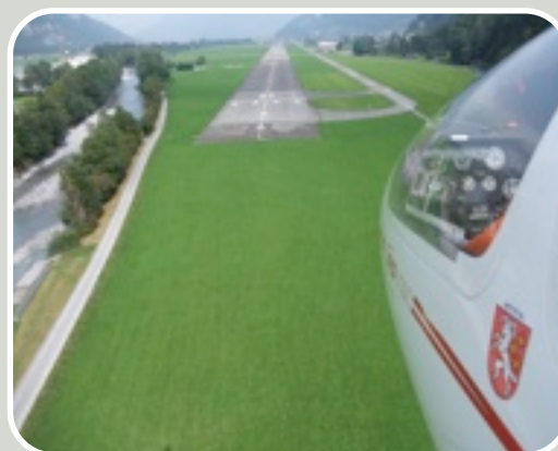
Final Piste 01 Mollis...

Mitte April führten wir zusammen mit der Motorfluggruppe einen Schnupperflugtag durch, an dem wir fast 40 Interessierte in die Luft bringen durften. Ebenfalls hat der Vorstand aktive Werbung an den umliegenden Schulen betrieben. Nachdem wir Anfangs Jahr nur einen einzigen